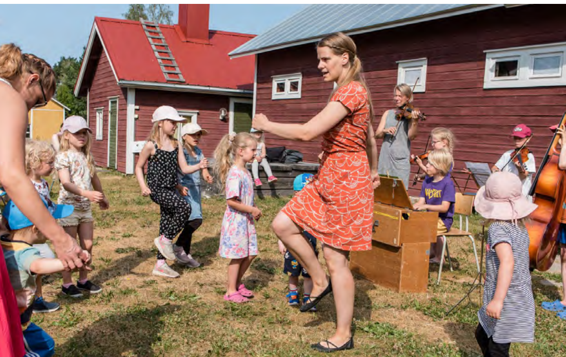
Lastenkulttuurikeskus Lykyn työpaja Kaustisen kansanmusiikkijuhlilla 2021, musisoimassa paikalliset näppäripelimannit ohjaajineen.

Viestinnällinen kriteeri: Kulttuurikasvatussuunnitelmatyötä tekeville toimijoille määritetään viestintävastaava, joka huolehtii siitä, että työn kehittämisestä viestitään sekä verkoston sisällä että ulkoisesti oikeille kohderyhmille. Ulkoisen viestinnän kanavina voi käyttää muun muassa uutiskirjeitä, tiedotteita, sosiaalista mediaa, suhdetoimintaa, tapahtumia ja verkkosivuja. Valtakunnallisesti käytössä ovat kulttuurikasvatussuunnitelma.fi ja lastenkulttuuri.fi -sivustot. Kulttuurikasvatussuunnitelmien koordinoimista vastaavien tahojen tehtävänä on pitää säännöllisesti yllä yhteyksiä sivistys- ja opetusalan toimijoihin sekä kulttuuriyhdysopettajiin alueellaan ja hyödyntää verkostossa tehtyjä materiaaleja ja erityisosaamista.