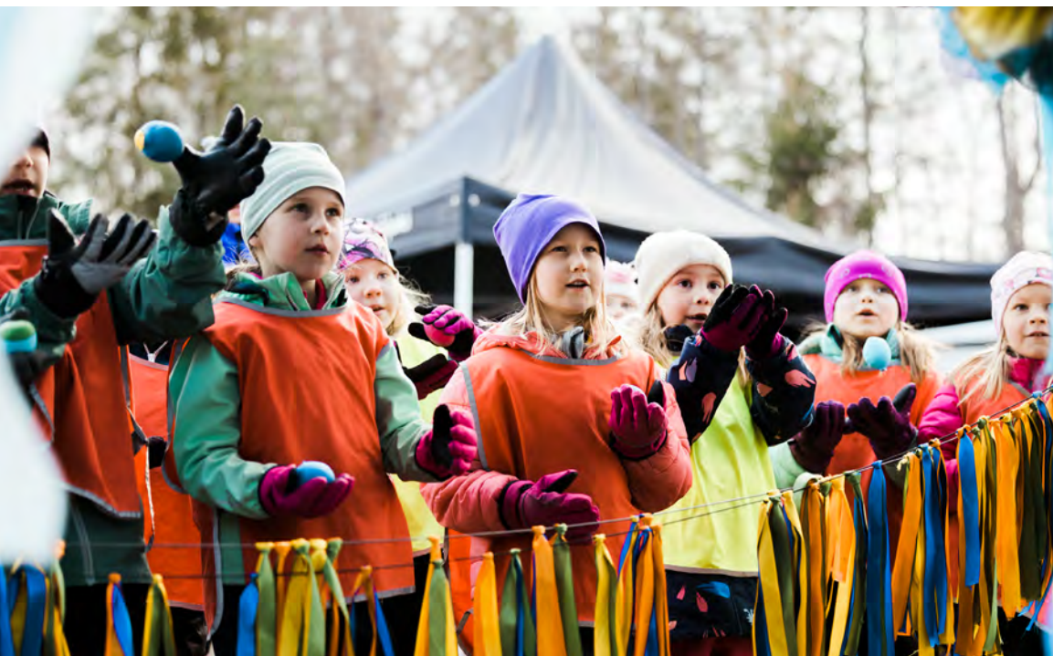
Eskarifestarit on Lastenkulttuurikeskus Louhimon järjestämä esikoululaisten oma festivaali.