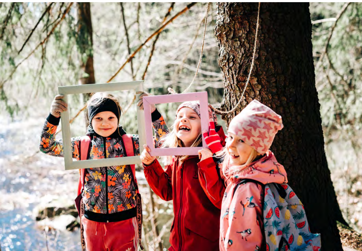
Pikkuprovinsi on Lastenkulttuurikeskus Louhimon järjestämä lasten oma festivaali.

Palveluissa huomioidaan sekä kulttuurinen että ihmisten moninaisuus eikä syrjintää hyväksytä. Kulttuurisen moninaisuuden toteutuminen edellyttää myös sitä, että lastenkulttuuritoimijat tuntevat paikallista kulttuuriperintöä ja tekevät yhteistyötä sen taitajien kanssa.