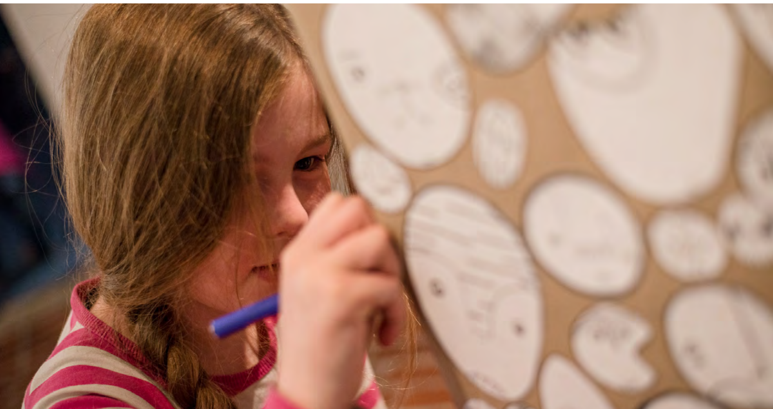
Lumotut sanat – Lasten ja nuorten sanataideviikkojen avajaisjuhlassa ja näyttelyssä Kun yö värittää vuonna 2015.

Ammatillisuuskriteeri: Näyttelyiden suunnittelussa huomioidaan taiteelliset ja pedagogiset lähtökohdat. Näyttelyiden tekijät ovat taiteen ja näyttelyrakentamisen ammattilaisia. Mahdollisuuksien mukaan näyttelyn tekemisessä osallistetaan lapsia ja nuoria. Näyttelyiden rakentamisessa huomioidaan turvallisuuskysymykset. Aikuisten ja lasten tekijänoikeuksia kunnioitetaan. Näyttelyprosessissa hyödynnetään Suomen lastenkulttuurikeskusten liiton kiertonäyttelyiden tuotanto-opasta, joka löytyy lastenkulttuuri.fi -sivulta.