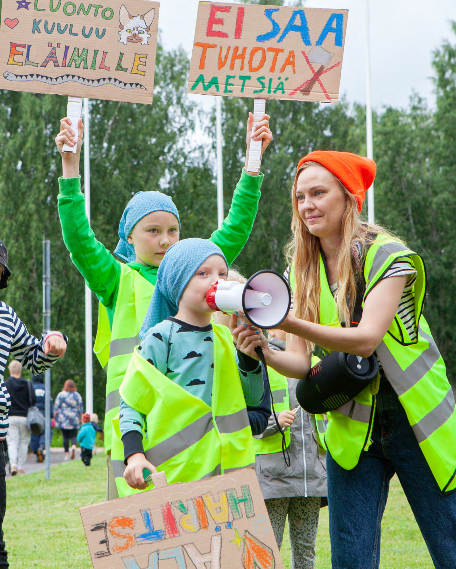
Lastenkulttuuritoimijat ovat tärkeässä roolissa tulevien sukupolvien äänen ja oikeuksien esiintuojina. Hippalot lasten taidefestivaaleilta 2022.