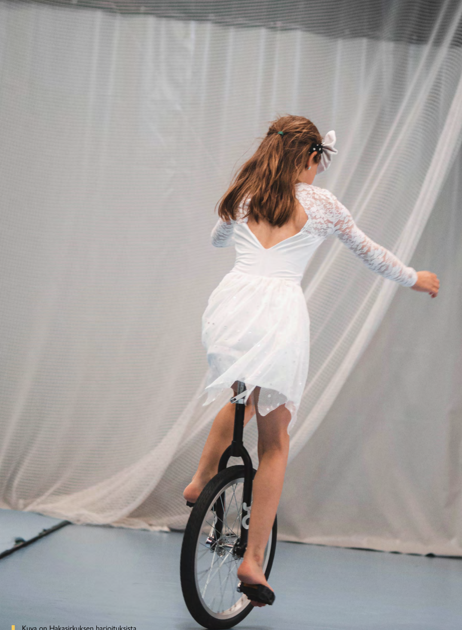
Kuva on Hakasirkuksen harjoituksista.