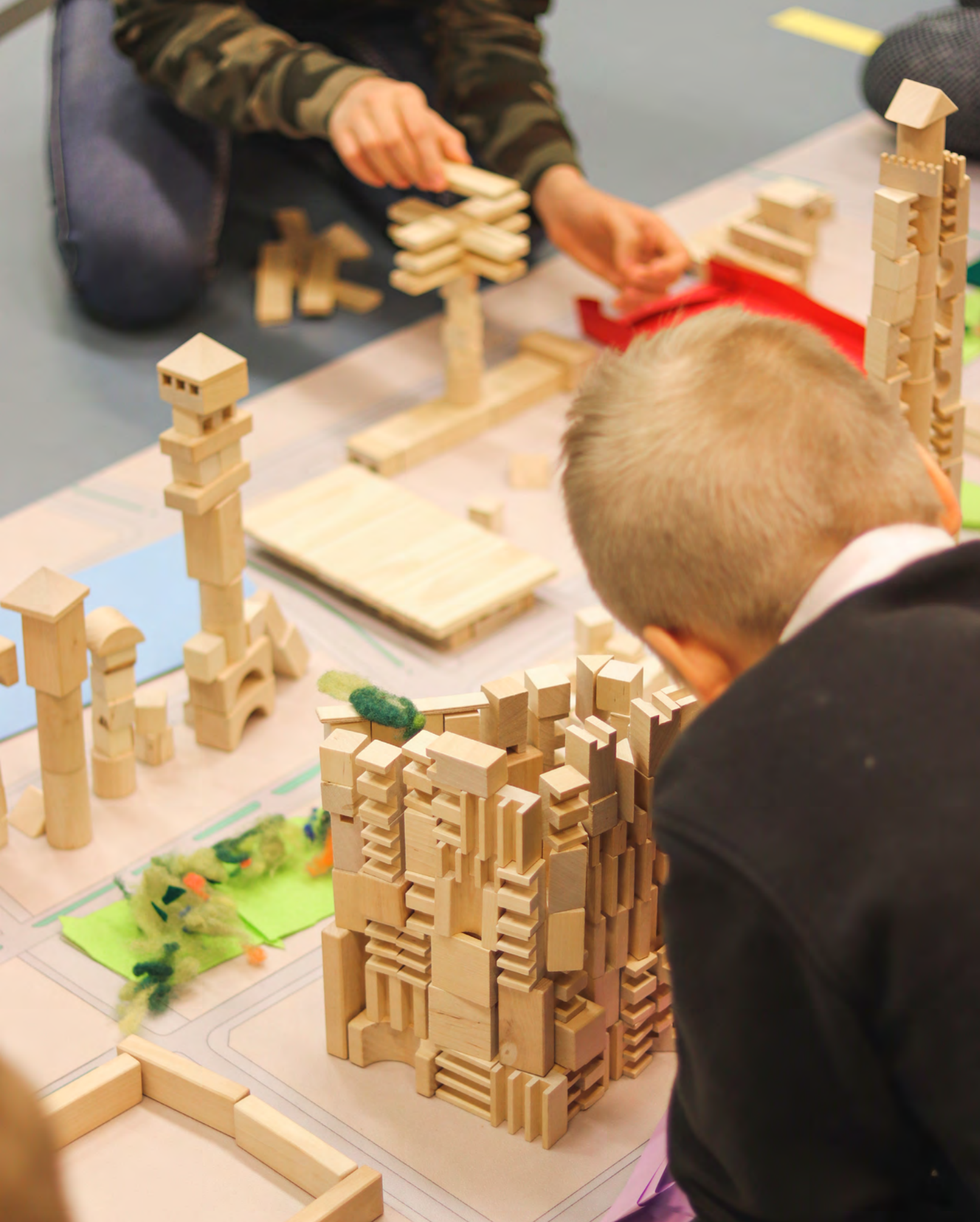
Seinäjoen kaupungin Kulttuurimatka -kulttuurikasvatussuunnitelmaan kuuluva 5. luokkien arkkitehtuurin työpaja.