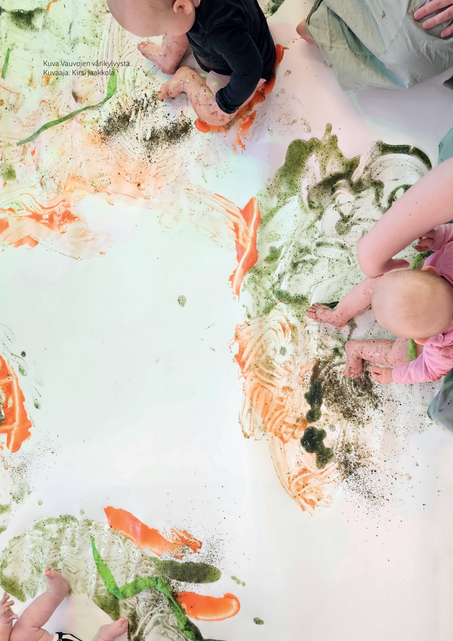
Kuva Vauvojen värikylvystä.