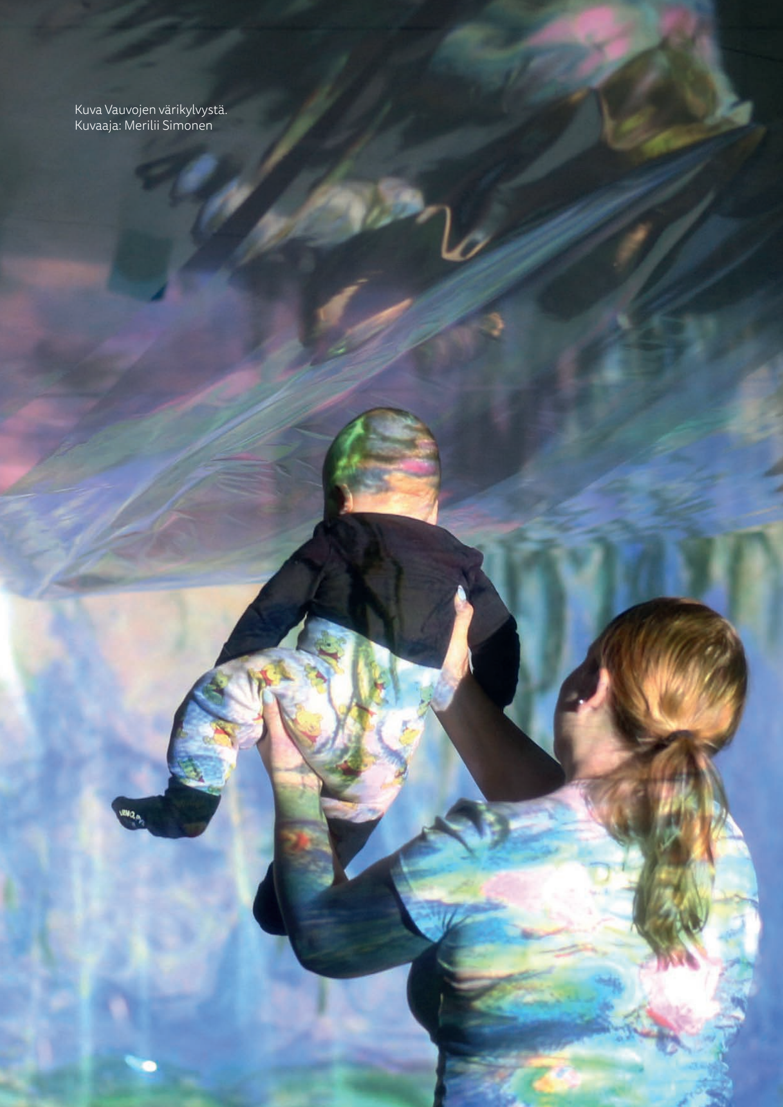
Kuva Vauvojen värikylvystä.