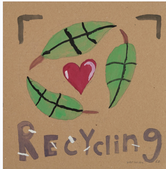
Kuva: Teemu Töyrylä, 2021