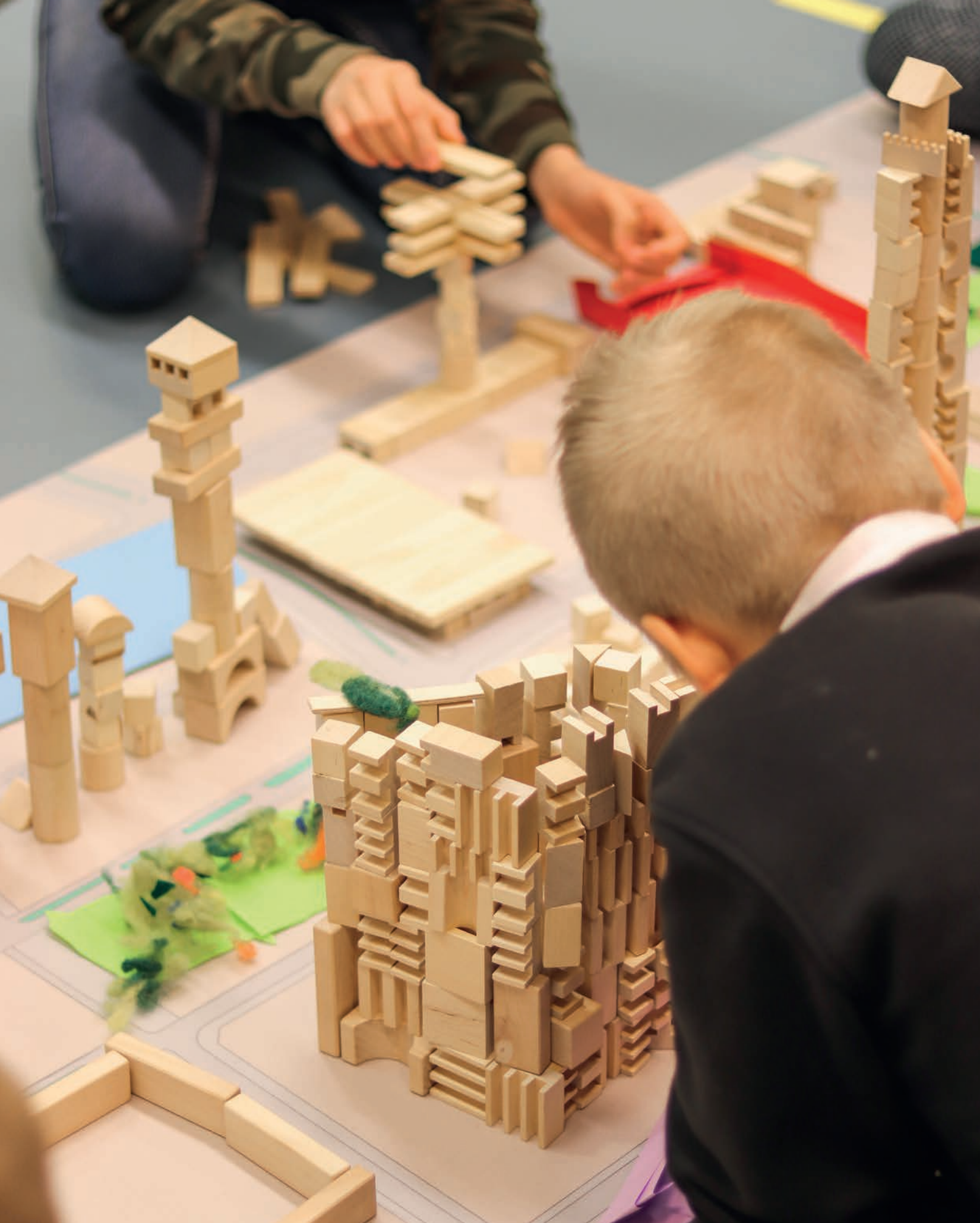
Seinäjoen kaupungin kulttuurikasvatussuunnitelmaan Kulttuurimatkaan kuuluva 5. luokkien arkkitehtuurin työpaja.