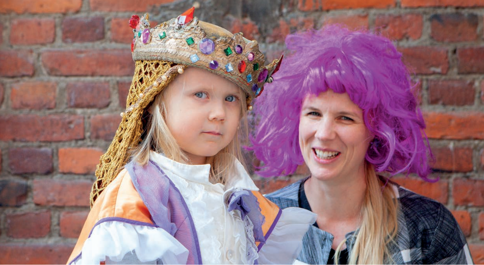
Lapsi ja hänen maailmansa ovat lastenkulttuuritoiminnan keskiössä. Kuva on Hippalot lasten taidefestivaaleilta 2022.

Lastenkulttuurin laatukäsikirja syntyi ensimmäistä kertaa vuonna 2013, ja se on päivitetty vuosina 2016 ja 2022. Nyt on uuden painoksen aika. Laatukäsikirja on laatuperusteiden hahmottamista lastenkulttuuripalveluissa ja toisaalta myös kuvaus siitä, miten lastenkulttuurikeskukset ja muut lastenkulttuurin tuottajat pyrkivät edistämään laatua toiminnassaan. Kirjassa esitellyt laadun kriteerit ovat tavoitteita, joita toimijat voivat omaksua käyttöönsä vähitellen ja soveltaen. Laatu syntyy pitkäjänteisesti kehittäen. Toivomme, että Lastenkulttuurin laatukäsikirja on avuksi kaikille niille, jotka haluavat tehdä laadukasta lastenkulttuuria. Liiton varsinaiset jäsenet sitoutuvat toteuttamaan lastenkulttuurin palveluja ja asiantuntijapalveluita laatukäsikirjaa noudattaen.