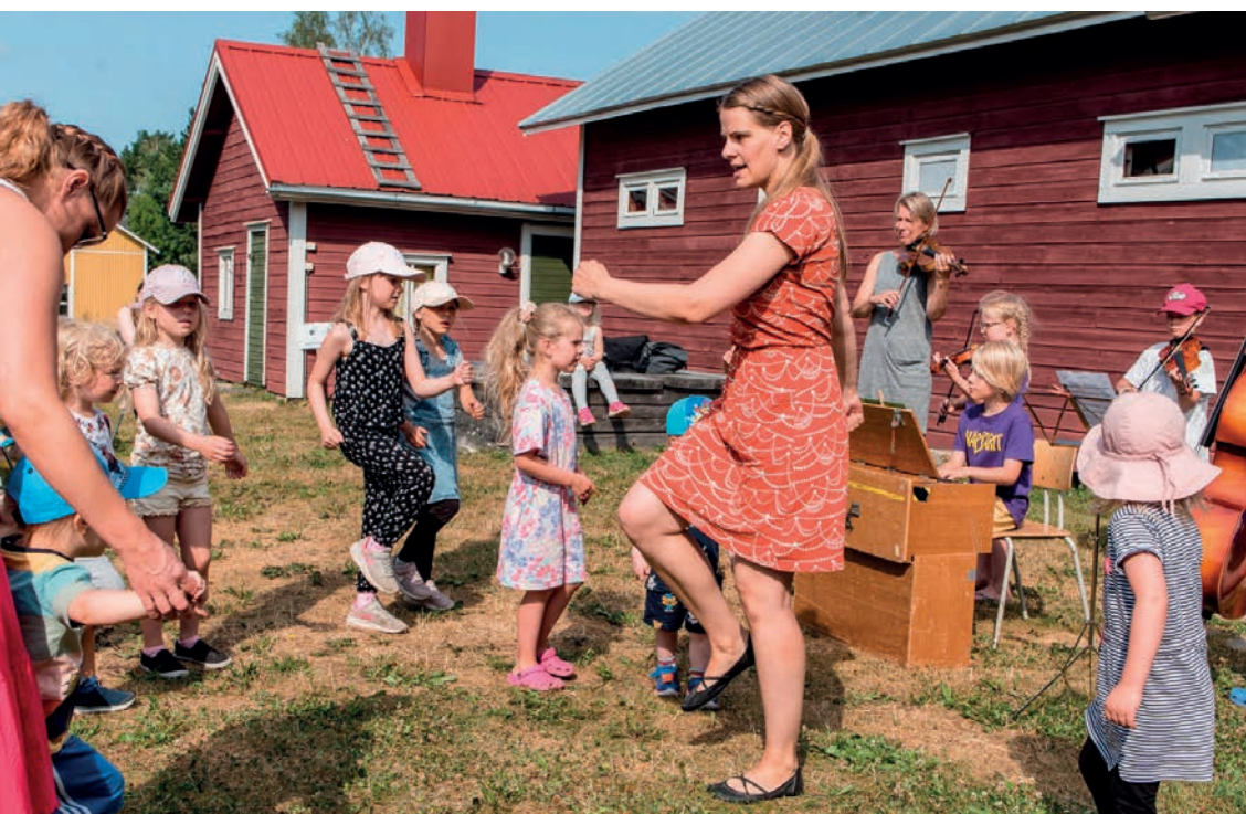
Paikalliset Näppäri-pelimannit ohjaajineen musisoimassa Lastenkulttuurikeskus Lykyn työpajassa Kaustisen kansanmusiikkijuhlilla vuonna 2021.

Kulttuurikasvatussuunnitelmien koordinoinnista vastaavien tahojen tehtävänä on pitää säännöllisesti yllä yhteyksiä sivistys- ja opetusalan toimijoihin sekä kulttuuriyhdysopettajiin alueellaan ja hyödyntää verkostossa tehtyjä materiaaleja ja verkoston erityisosaamista.