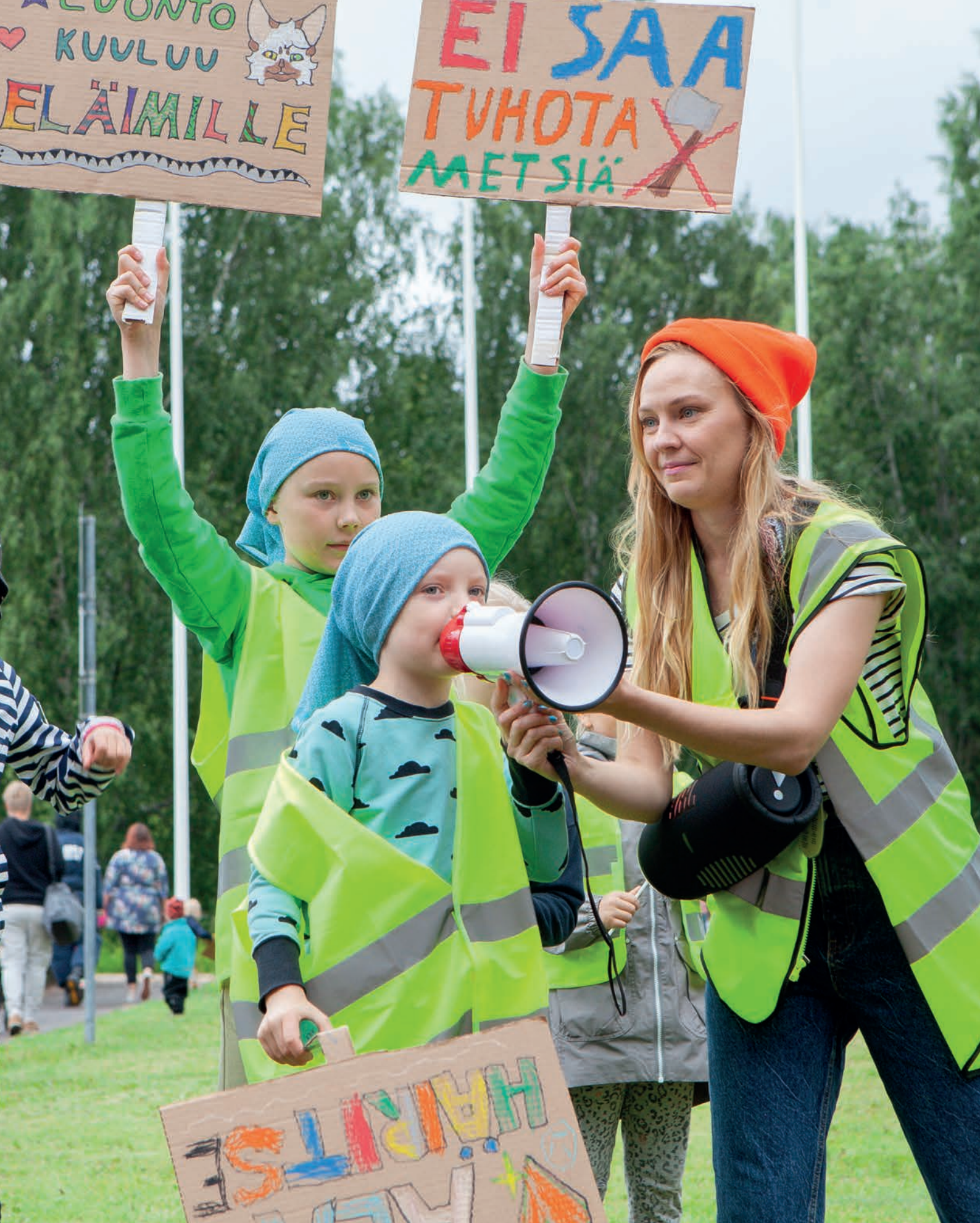
Lastenkulttuuritoimijat ovat tärkeässä roolissa tulevien sukupolvien äänen ja oikeuksien esiintuojina. Lasten taidefestivaali Hippaloista 2022.