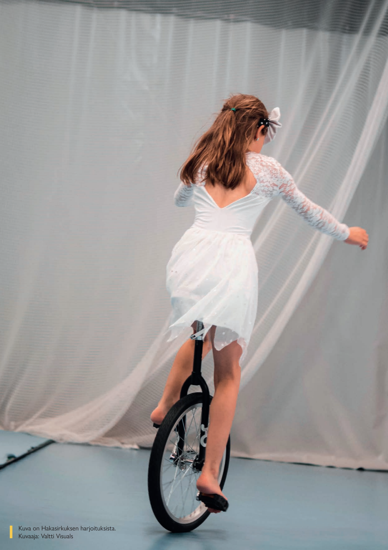
Kuva on Hakasirkuksen harjoituksista.