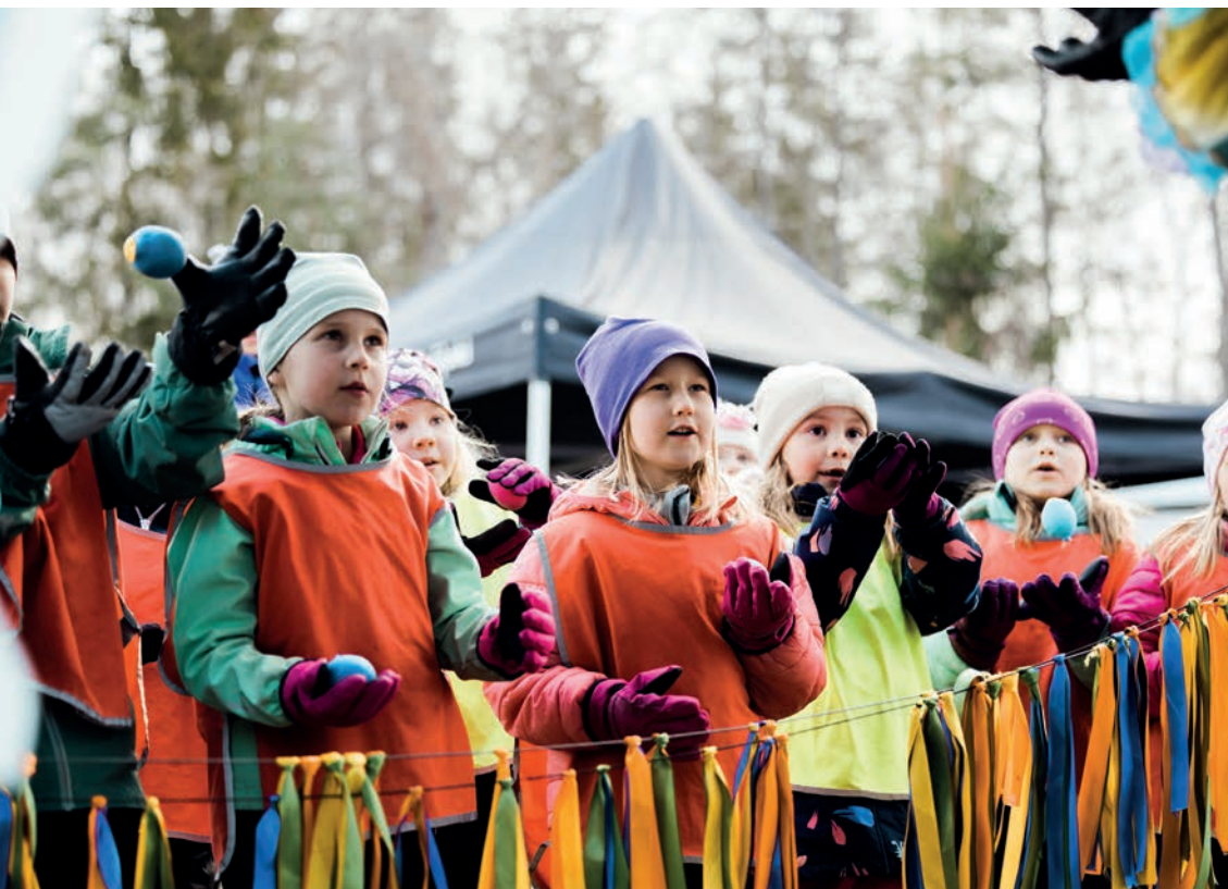
Pikkuprovinsi on Lastenkulttuurikeskus Louhimon järjestämä lasten oma festivaali.

Lastenkulttuuripalvelut perustuvat kulttuurisen ja inhimillisen moninaisuuden kunnioittamiseen, eikä syrjintää hyväksytä missään muodossa. Kulttuurisen moninaisuuden toteutuminen edellyttää myös sitä, että lastenkulttuuritoimijat tuntevat paikallista kulttuuriperintöä ja tekevät yhteistyötä alan taitajien kanssa.