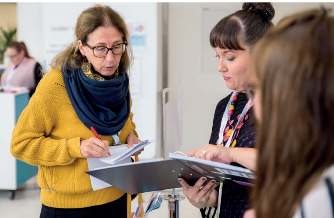
Lastenkulttuuritoimijat osallistuvat Suomen lastenkulttuuriliiton järjestämiin verkoston yhteisiin tapahtumiin. Kuva on kansainvälisestä Lastenkulttuurifoorumista vuodelta 2019.

Viestinnällinen kriteeri: Verkostoyhteistyö perustuu avoimeen tiedon jakamiseen, vuorovaikutukseen ja yhteisten tavoitteiden näkyväksi tekemiseen. Verkoston yhteiset tapahtumat, hankkeet ja muut yhteistyörakenteet ylläpitävät keskustelua lastenkulttuurin ajankohtaisista teemoista sekä mahdollistavat kokemusten, osaamisen ja hyvien käytäntöjen jakamisen toimijoiden välillä. Viestinnän avulla tehdään näkyväksi lastenkulttuurityötä, sen vaikutuksia ja menetelmiä sekä vahvistetaan alan tunnettua niin verkoston sisällä kuin sidosryhmien, median, päättäjien ja kansainvälisten kumppaneiden keskuudessa. Viestinnän avulla vahvistetaan myös alan yhteistä toimintakulttuuria.